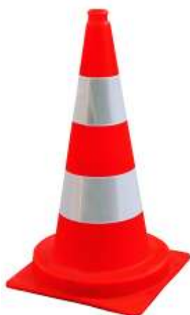
750er - ca. 4,2 kg

Leitkegel hergestellt aus PVC in einteiliger Ausführung Stapelsituation optimiert um ein festsaugen der Kegelkörper zu verhindern.