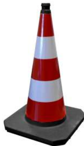
750er - ca. 5,1 kg

307.611750.00.32 Leitkegel PVC - R Typ „III“ mit Folie Typ 2 750 mm Gewicht ca. 5,0 kg