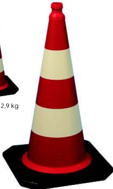
750er - ca. 5,8 kg