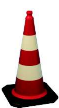
500er - ca. 2,9 kg