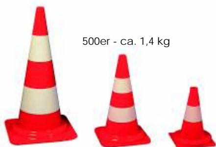
500er - ca. 1,4 kg