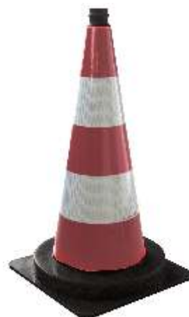
PVC Kegel 750 mm mit Folie Typ 2 750er - ca. 4,2 kg

307.610750.00.32 TL Leitkegel PVC - R Typ „II“ mit Folie Typ 2 750 mm Gewicht 4,2 kg Prüf-Nr. V4-44/2005