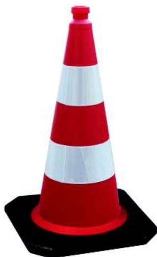
750er - ca. 5,8 kg 500er - ca. 2,9 kg

Leitkegelfuß aus Recyclingmaterial mit Kippschutzkante, Kegelkörper aus HDPE geblasen, mit Aufnahme für Lampenadapter. Ausgerüstet mit Stapelnoppen um ein festsaugen der Körper zu verhindern.